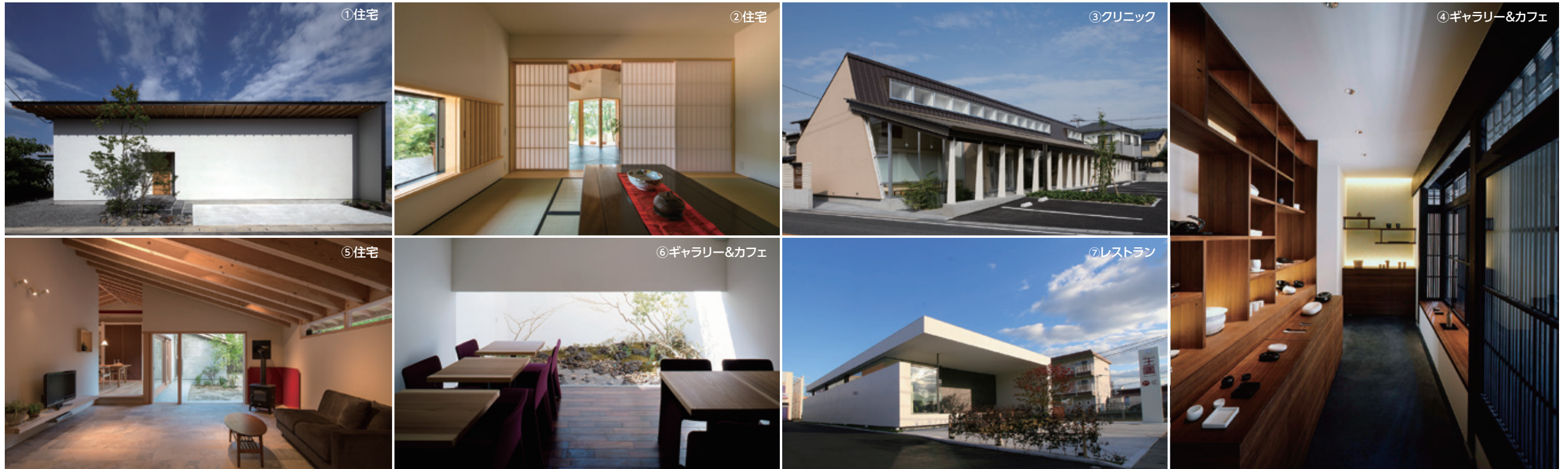
使用写真 ①②⑤住宅事例 設計:井上昌彦・岡本一真 撮影:杉野圭・米田正彦・松村芳治 / ③クリニック事例 設計:岡本一真 撮影:松村芳治 / ⑦レストラン事例 設計:岸研一 / ④⑥店舗事例 設計:吉川弥志 撮影:杉野圭