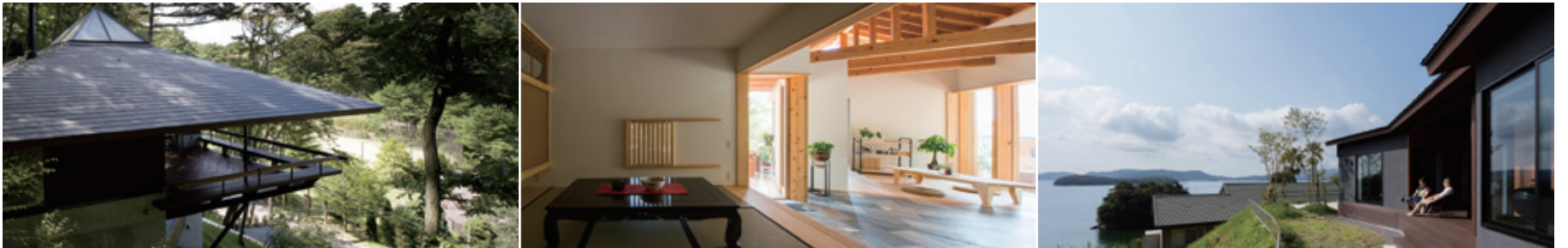
使用写真(左から) 設計:山本学/設計:岡本一真/設計:山澤宣勝