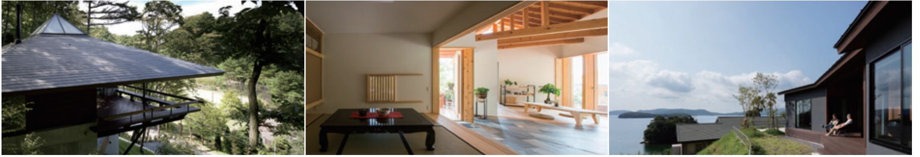
使用写真(左から) 設計:山本学/設計:岡本一真/設計:山澤寛勝